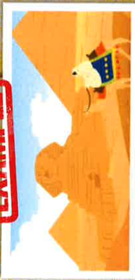
The Great Sphinx of Giza

أبو الهول من الجيزة يشار إليه عادة باسم أبو الهول من الجيزة أو مجرد أبو الهول ، هو تمثال الحجر الجيري لأبو الهول مستلق ، مخلوق أسطوري مع جسد أسد ورأس الإنسان. تواجه مباشرة من الغرب إلى الشرق ، وتقف على هضبة الجيزة على الضفة الغربية لنهر النيل في الجيزة ، مصر. ويعتقد عمومًا أن أبو الهول يمثل فرعون